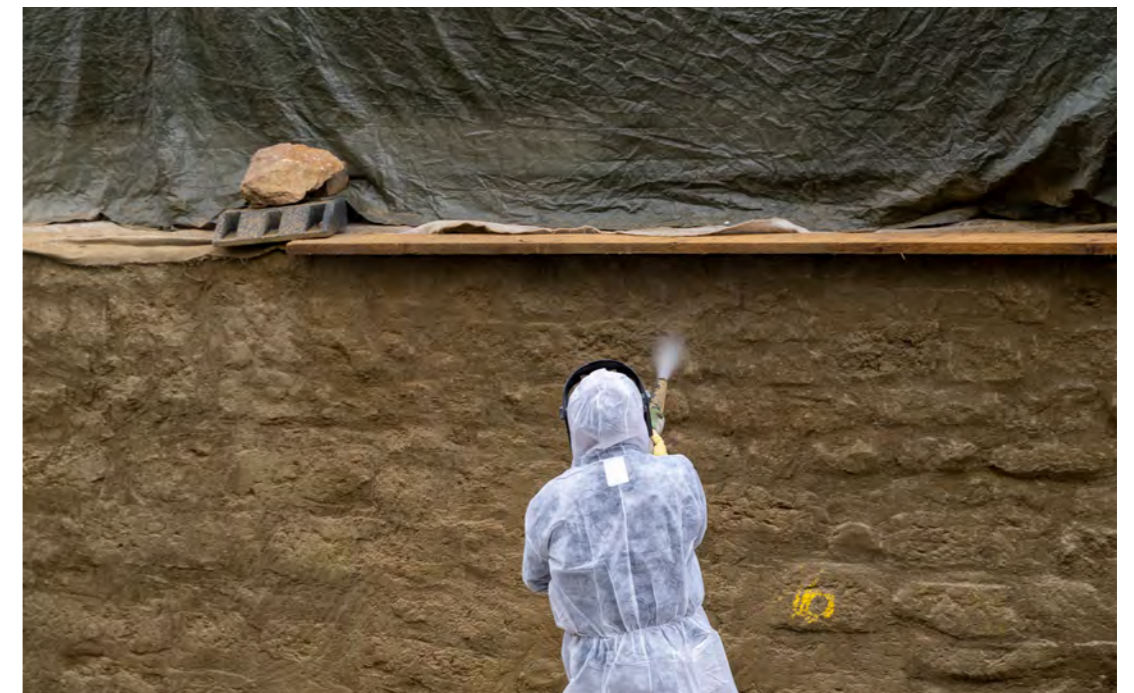
Mauerwerkssanierung Leinekanal Göttingen: Trockenspritzen.