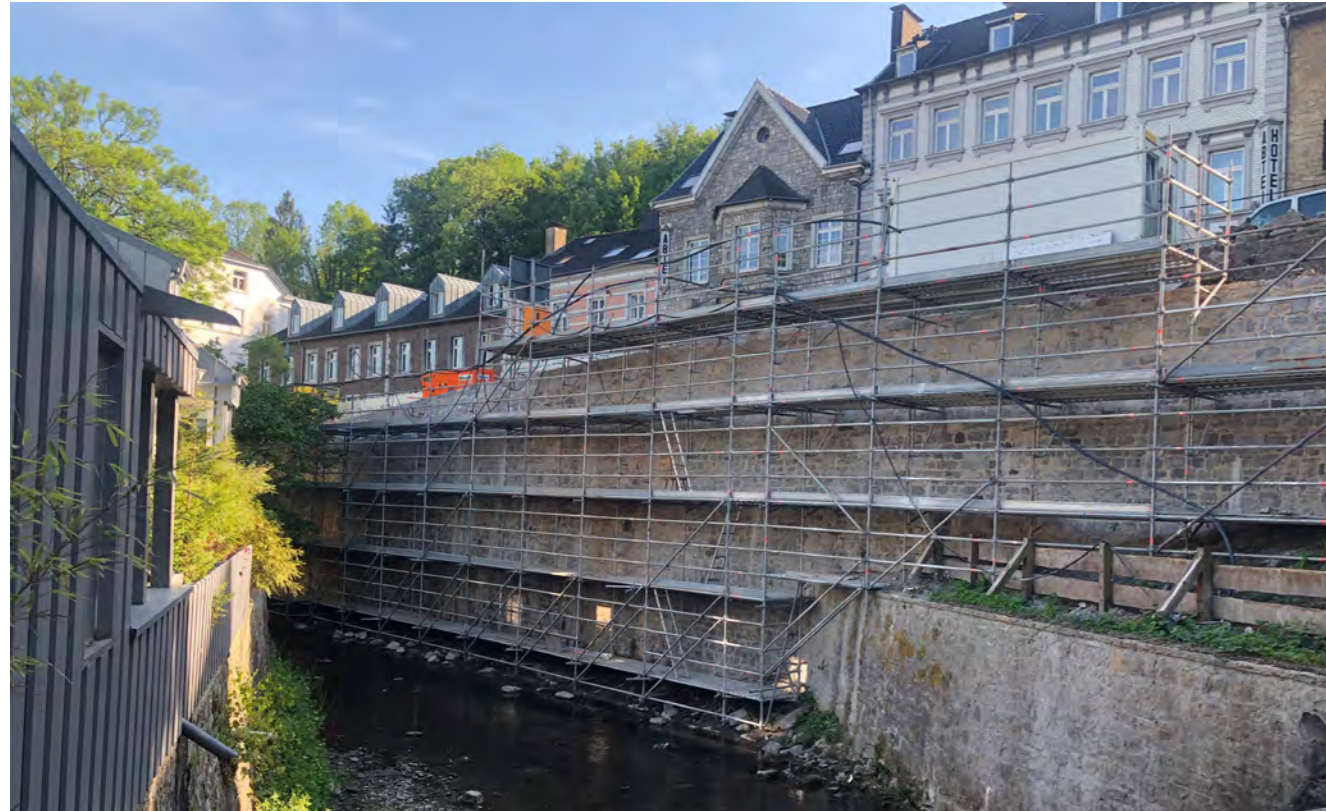
Historische Stadtmauer in Aachen.