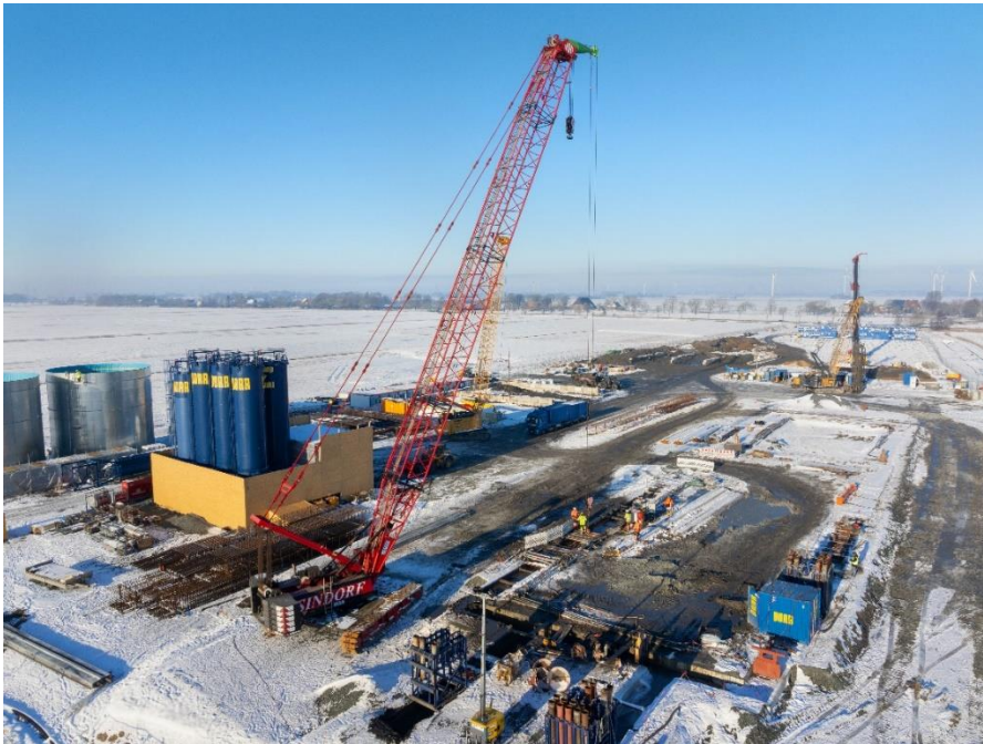
In Wewelsfleth (Schleswig-Holstein) entsteht der Startschacht im Projekt ElbX.