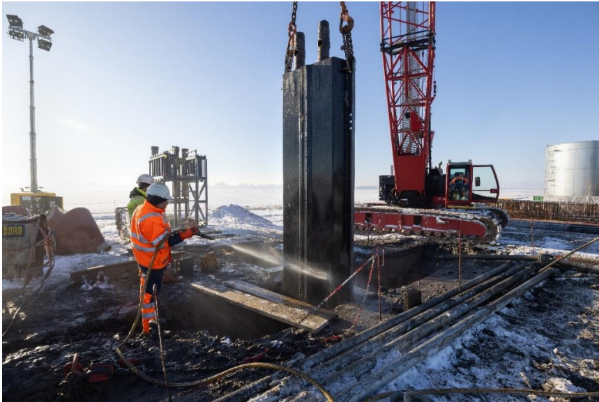
Für die Zielbaugrube sind bereits 23 Schlitzte mit je rund 6 m Länge und 36 m Tiefe fertiggestellt.