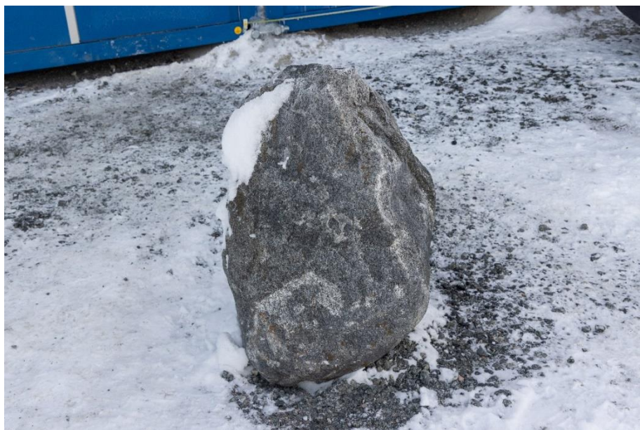
Im Rahmen der Spezialtiefbauarbeiten wurde Granit-Gneis-Findlings in 27 m Tiefe geborgen.

Die Presseinformation inklusive hochauflösendem Bildmaterial steht Ihnen in unserem Pressebereich zum Download zur Verfügung. In unserem Pressekit finden Sie allgemeine Informationen zur PORR GmbH & Co. KGaA sowie Logos und allgemeines Bildmaterial.