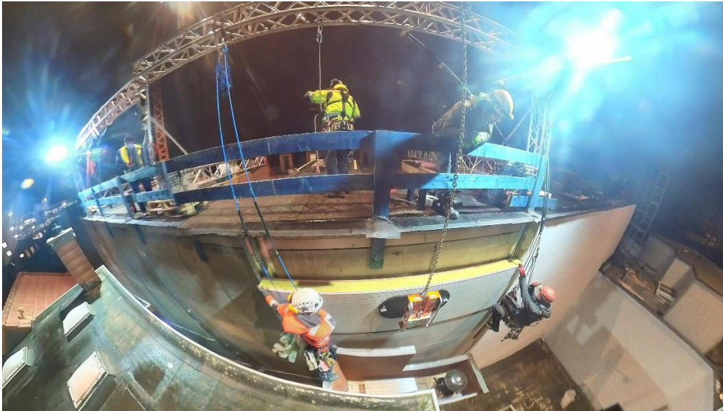
In 16 m Höhe wurden die restlichen 90 Dämmplatten auf einer Fläche von 300 m 2 montiert.

Die Presseinformation inklusive hochauflösendem Bildmaterial steht Ihnen in unserem Pressebereich zum Download zur Verfügung. In unserem Pressekit finden Sie allgemeine Informationen zur PORR GmbH & Co. KGaA sowie Logos und allgemeines Bildmaterial.